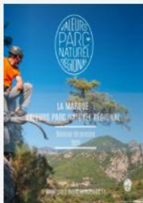
Dossier de presse

Plus d'infos : www.parc-haut-languedoc.fr/rencontrer/la-marque-valeurs-parc