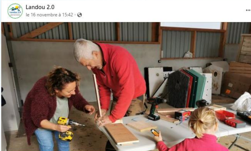
Ce matin nous avons construit des mangeoires à oiseaux. Un moment de partage très convivial ! Prochain atelier déco de Noël le 14 décembre !