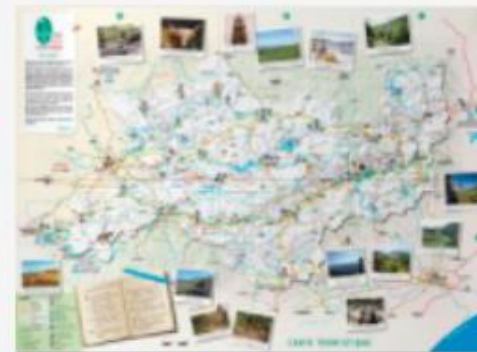
Carte touristique (activités, produits locaux, etc.)