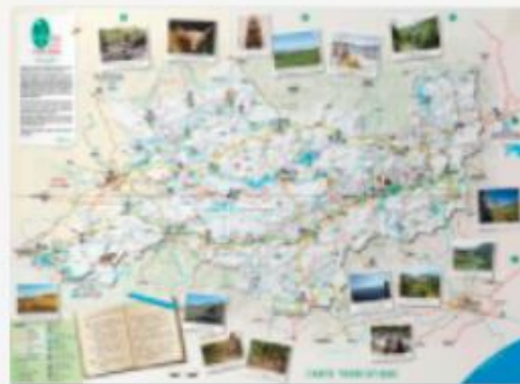
Carte des hébergements